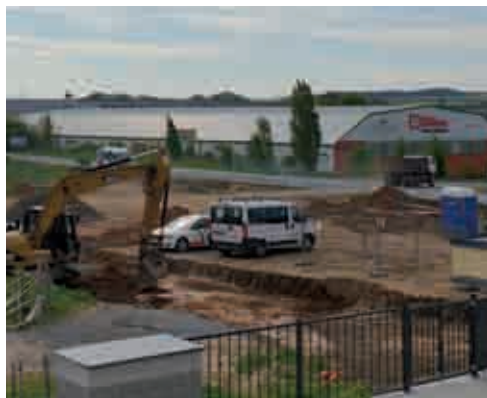
Výstavba kruhového objezdu u tenisových kurtů a fabriky SOPO již začala.

Jedna z nejdůležitějších dopravních tepen na katastru obce Modletice prochází rozsáhlou rekonstrukcí. Jedná se o silnici II/101, spojující mj. města Říčany a Jesenice. Rekonstrukce proběhne v několika etapách. První část bude probíhat od 4. května a skončí 14. června. Dojde k opravě silnice v úseku od osnicového hřbitova až ke křižovatce s obcemi Herink a Dobřejovice (tzv. U váhy). Zároveň v Modleticích u tenisových kurtů a nové fabriky SOPO dojde k výstavbě kruhového objezdu. Příští rok nás pak čeká rekonstrukce této silnice od váhy právě k výše zmíněné okružní křižovatce. Tedy přímo část, která se Modletických občanů dotkne nejvíce. -js-