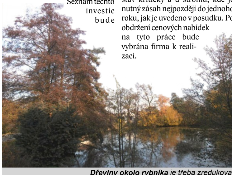
Dřeviny okolo rybníka je třeba zredukovat