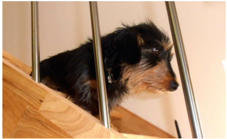
Poplatky za psy se následující rok nezvýší

průběžně aktualizován a bude sloužit jako podklad pro plánování výdajů pro delší časové období. Aktuálně pak bude sestaven plán investic na rok 2013.