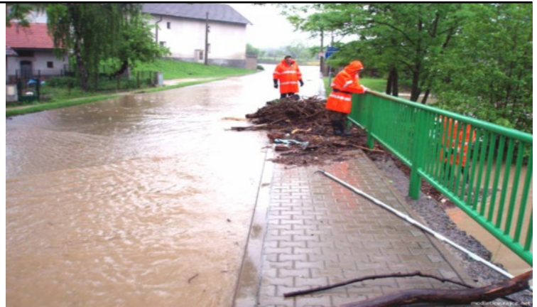
Projednává se aktualizace povodňového plánu obce

Zastupitelé se dohodli, že hodnotící komise budou složeny ze zástupců autorského