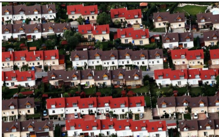
Zastupitelé vydali negativní stanovisko ke stavbě řadových domů v obci

Zastupitelé byli seznámeni s problematikou likvidace odpadu, vzniklého z čištění komunikací.