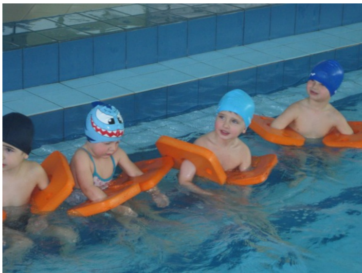
Předplavecká výuka

Výsledek hlasování: pro 5, proti 0, zdržel se 0, nepřítomno 2