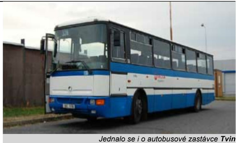
Jednalo se i o autobusové zastávce Tvín