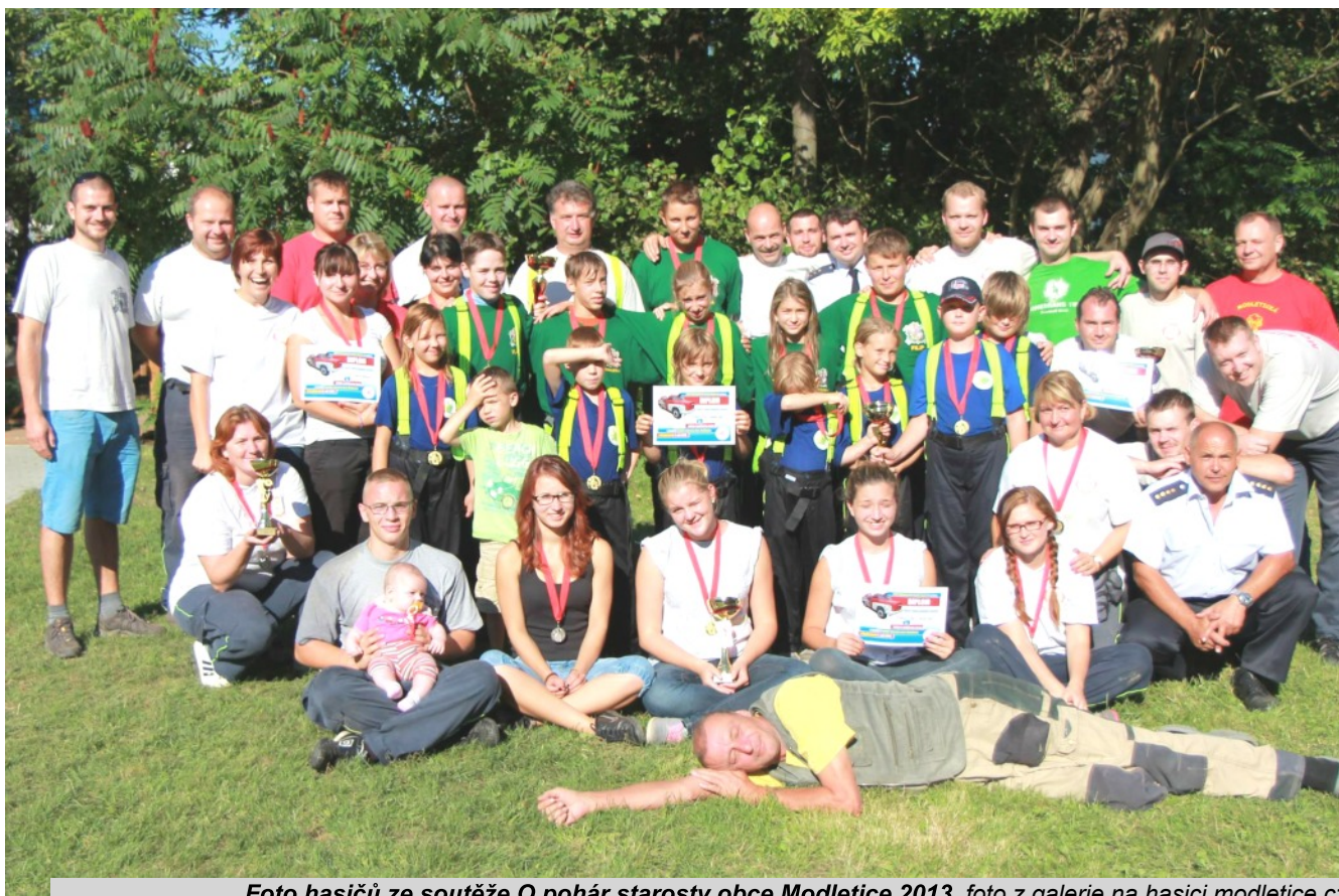
Foto hasičů ze soutěže O pohár starosty obce Modletice 2013

Jak už bylo řečeno v úvodu: Být dobrovolným hasičem opravdu není jen zábava. Ale jak mají uvedeno na svém praporu, tak i konají, protože opravdu jsou „bližnímu ku pomoci.“