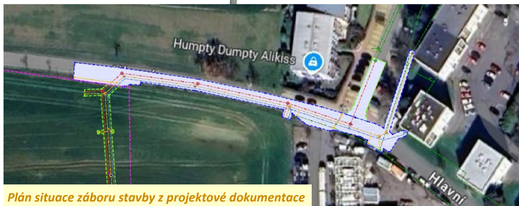
Plán situace záboru stavby z projektové dokumentace