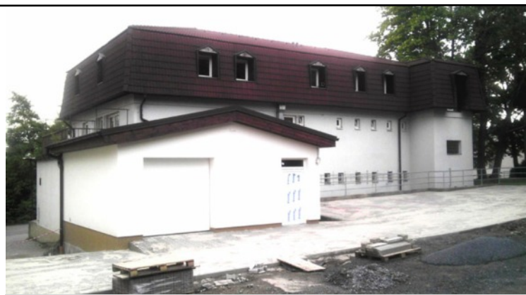
Příjezdová cesta a parkoviště u OÚ jsou téměř před dokončením

Starosta obce informoval zastupitele o neustálém ničení oplocení obecního majetku. Za poslední rok bylo zaznamenáno