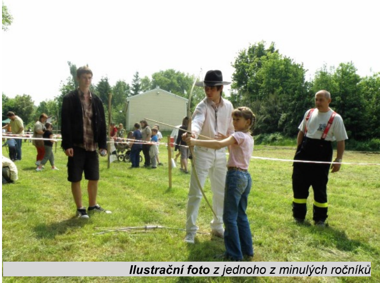
Ilustrační foto z jednoho z minulých ročníků

Oblíbená kulturně-společenská akce proběhne v sobotu 1.června na louce pod panelovým sídlištěm