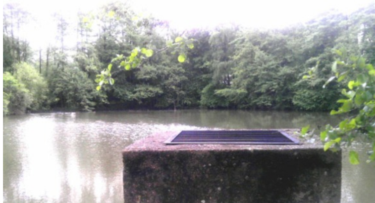
Probíhají přípravy pro podání veřejné zakázky na revitalizaci rybníka

Starosta obce informoval zastupitele o stavu připravované veřejné zakázky na ČOV Modletice a na revitalizaci Zámeckého rybníka. Obec Modletice si zřídila pro účely veřejných zakázek profil zadavatele, který je umístěn na www.stavebnionline.cz , kde budou veřejné zakázky obce zveřejňovány. V současné době je zveřejněn záměr vyhlásit VZ na intenzifikaci ČOV Modletice