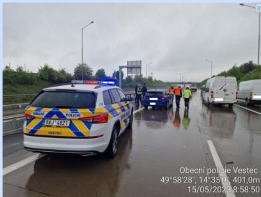
Obecní policie Vestec 49°58'28", 14°35'01" 401,0m 15/05/2023 8:58:50

Na místě bylo zjištěno, že díky dešti a snížené viditelnosti řidič osobního automobilu, jedoucí v levém pruhu ve směru na Říčany, nedobrzdl do před ním zpomalující kolony a zezadu narazil do motorového vozidla s připojeným přívěsným vozíkem. Oba řidiči, kteří ve svých vozidlech cestovali sami, vyvázli z původně hroživě vypadající dopravní nehody bez zranění, obě vozidla zůstala po nehodě stát v rychlém pruhu komunikace D0. Z místa byla neprodleně strážníky podána zpráva Operačnímu důstojníkovi HZS Středočeského kraje a strážníci do příjezdu dvou vozidel HZS Středočeského kraje, stanice Říčany a dvou hlídek PČR v místě dopravní nehody usměrňovali provoz. Po příjezdu hlídky PČR Skupiny dopravních nehod strážníci z místa odjeli za plněním dalších povinností.